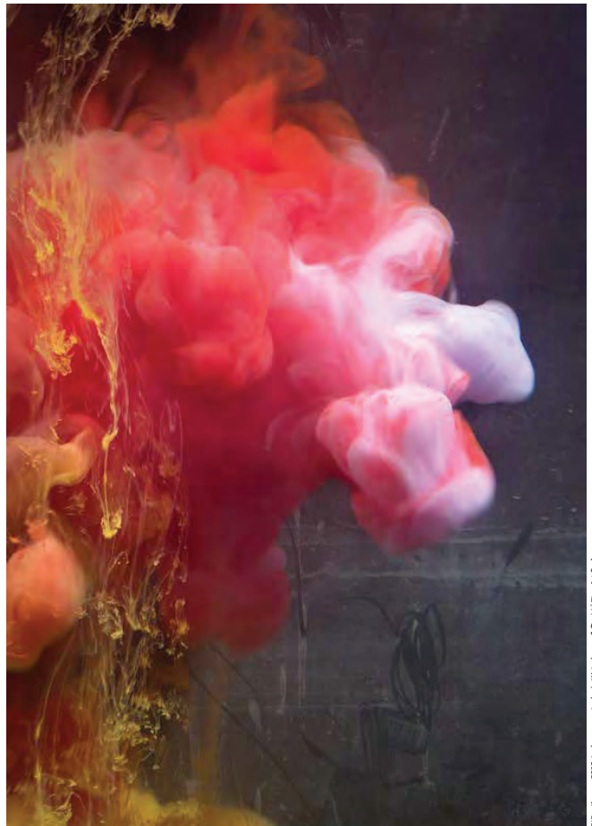
© Kim Keever, 2013. Imágenes cortadas de Waterhouse & Dodd | Fine Art Bookers